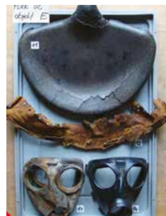
Nálezy z Nesvětic.

Archeologický průzkum vesnice na předpolí lomu Bílina, kterou v první polovině 15. století vyrabovali a zničili husité, vydává 600 let stará tajemství. Ve studni našli archeologové i tři lidské lebky a postupně odkrývají základy kostela, šlechtického sídla a dalších obytných a hospodářských staveb. Vedle mincí, podkov či olověných destiček s rytinami symbolů evangelistů našli i drobné keramické hračky koníků, z nichž jeden nese na hřbetě i jezdce.