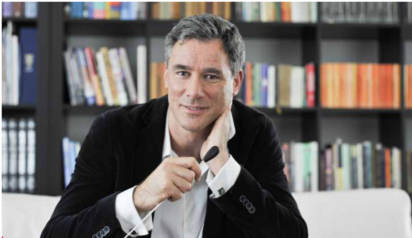
Dirigent Charles Olivieri-Munroe se stal miláčkem teplického publika.