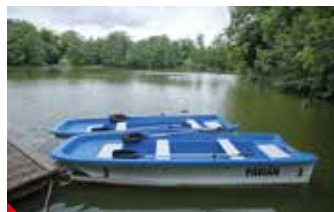
i přístaviště pro pramice. Návštěvníci Zámecké zahrady

Teplice – Horní rybník v Zámecké zahradě prošel revitalizací. Po třiceti letech byl vypuštěný. Během samotných oprav, které městskou kasu přišly na více než 7 milionů korun, se z rybníka odstranilo 1 800 tun bahna. Přibýlo nové vypouštěcí zařízení a bezprostředně u něj několik opěrných zdí. Mimo jiné bylo upraveno