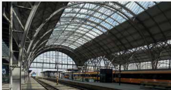
Ocel a sklo chrání nástupiště Hlavního nádraží v Praze

Další stavbou, kde se lze setkat se skly AGC, je ojedinělý nadzemní autobus mezi stanicemi Rajská zahrada a Černý Most (již z roku 1998) či stanice Hradčanská, jejíž vstupy mají azurové zabarvení. Od roku 2015, kdy na lince A přibýly nové stanice, dominuje prosklená klenutá střecha stanicí Nemocnice Motol. Vrstvené bezpečnostní sklo s mléčnou fólií bylo použito pro výtahovou šachtu