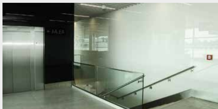
Skleněné obklady stěn na Letišti Václava Havla

krčky. Sklo jako snadno udržitelný a odolný materiál našlo své uplatnění na obkladech zdí i přepážek, v transparentní podobě jako zábradlí či izolační zasklení. Jelikož se jedná o veřejné prostory, je i v tomto případě nutné zvýšit odolnost prostřednictvím dalšího zpracování základního skla, a to procesem laminace, tepelným zpracováním nebo obojím, dále použitím bezpečnostní fólie. Od roku 2006 je cestujícím k dispozici Terminál 2, který zajišťuje lety v rámci shengenského prostoru. V roce 2018 uvedlo letiště v rámci Terminálu 1 do provozu nový,