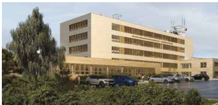
Projektový model. Tak by měla vypadat budova Výstupní 2 po rekonstrukci.

Ano. Museli jsme v krátkém čase přestěhovat potřebné vybavení pracoviště Výstupní 2 do opuštěné budovy po gymnáziu Stavbařů 5 na Severní Terrase. Ještě předtím bylo třeba nově instalovat sítě a zlikvidovat vyřazený majetek a já musím poděkovat některým žákům a učitelům, že se do budování provizoria zapojili a na spoustě instalačních prací se podíleli. I to je důkaz, že naši žáci jsou dobře připraveni pro praxi. ► pr